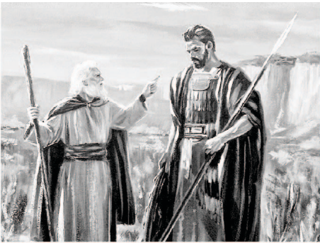
Samuel reprimands Saul for disobeying God's Command

एक क्षणको निमित्त, परमेश्वरले शाऊललाई यसो भन्दै अमालेकीहरूलाई नष्ट गर्न आज्ञा दिनुभयो, “अब जा र पूर्णरूपमा नष्ट गर्” (१ शमूएल १५:२) । तापनि, “राम्रा भएका थोकहरू” राख्ने छनोट गरेर शाऊलले आफैलाई धोका दिए (१ शमूएल १५:९) । योग्य भएका कुराहरू राख्ने न्याय गरेर तिनले आफैमाथि त्यो लिए, त्यसकारण, तिनका कार्यहरू न्यायसंगत थिए भनेर सोचेर आफैलाई धोका दिइरहे । परमेश्वरको निर्देशनबाट अलग भए पनि शाऊलले दावी पनि गरे, “मैले परमप्रभुको आज्ञा पूरा गरेको छु” (१ शमूएल १५:१३) ।