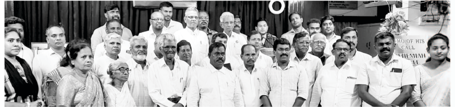
Alumini member of Nehemiah Bible College

तामिल भाषामा साथै हिन्दी भाषामा अध्ययन गर्न नहेम्याह बाइबल कलेजहरूका निमित्त हामीलाई धेरै विद्यार्थीहरूको साँचो छ। कृपया हामीलाई सहायता गर्नुहोस् र परमेश्वरको सेवा गर्ने उत्कट चाहना भएका विद्यार्थीहरूलाई परिचय गराइदिनुहोस्।